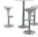
Set Snow 199,00 EUR/Stück