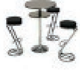
Set Z 126,00 EUR/Stück