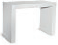
Brückenstehtisch 140x70x110 cm 113,00 EUR/Stück