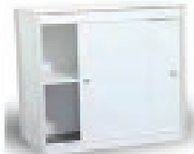
Theke Leipzig, verschließbar 100x50x100 cm 98,00 EUR/Stück