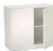
Sideboard Basel 80x40x80 cm 59,00 EUR/Stück