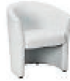
Sessel Romeo 63x59x77 cm 64,00 EUR/Stück