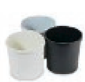
Papierkorb Farbe _____ 6,00 EUR/Stück

Weiteres Mietmobiliar und Ausstattung finden Sie im Serviceheft Standbau.