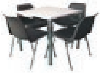
Set Reihenstuhl 93,00 EUR/Stück