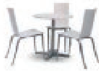
Set Olly Tango 156,00 EUR/Stück